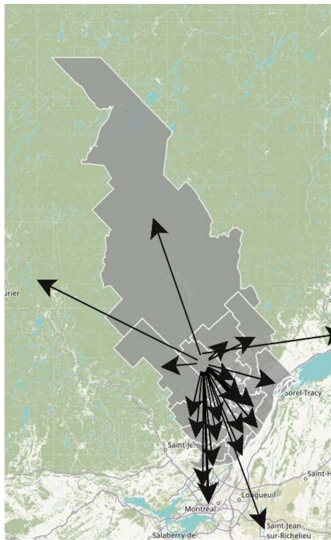
Carte tirée de l'Atlas électronique de l'emploi de la région de Lanaudière ( http://www.atlas-lanaudiere.ucs.inrs.ca/ ).